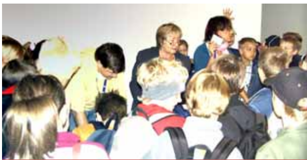
Die Jung-Studierenden schreiben sich ein