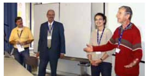
Das Kinder-Uni Team freut sich auf eine Fortsetzung dieser Veranstaltung.